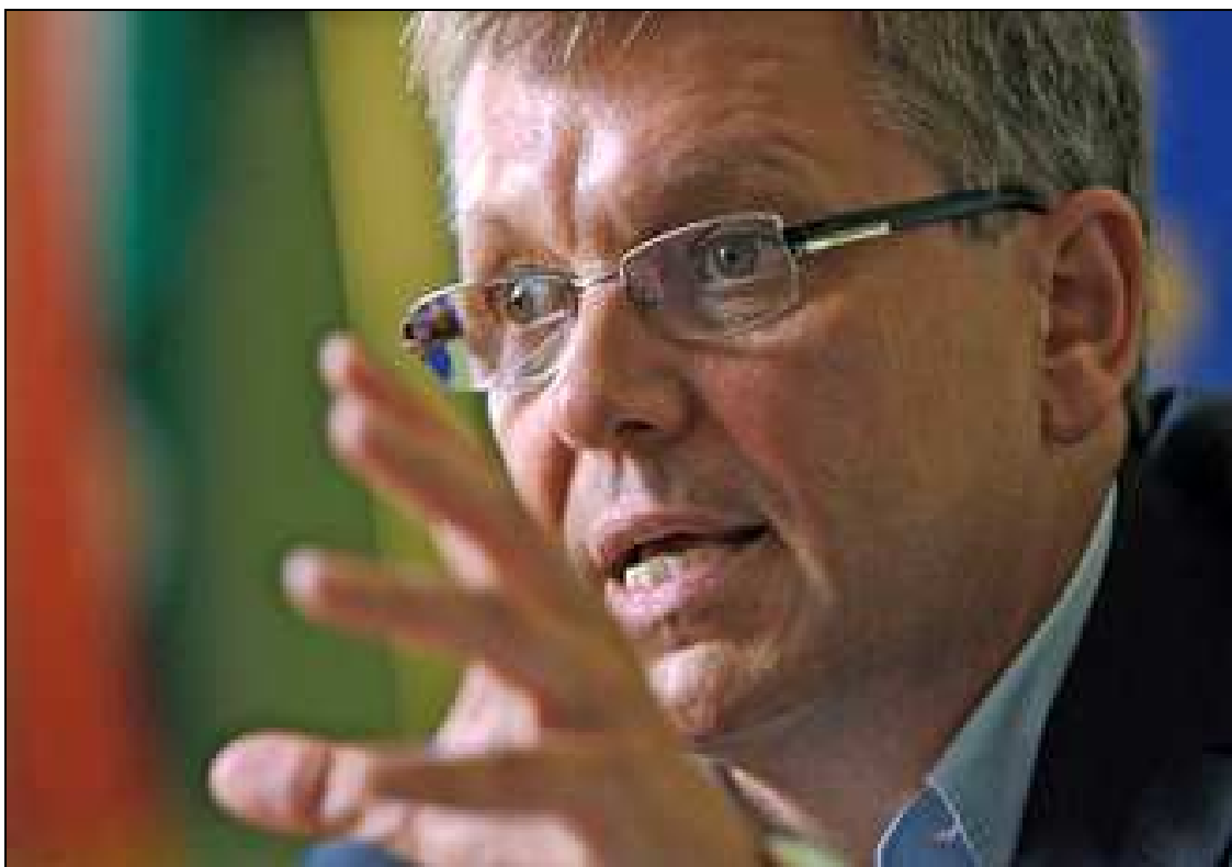
Matolcsy: amit lát és amit nem

A Fordulat és reform című munkát a rendszerváltás alaplátvának szokták tekinteni, holott inkább „koradogmatikus” fogyasztásellenes álláspontot, főleg gyakorlatot tükröz. Az igazsághoz tartozik, hogy a sztálini időkben sem vállalták ezt az attitűdöt, hangsúlyozottan ideiglenesnek, a két világrendszer harcából következőnek tartották. Soha nem adták fel azt a tételt, hogy a termelés célja a lakosság szükségleteinek minél teljesebb kielégítése. A sors iróniája, hogy a fogyasztáscsökkentést szokták receptként felírni a pénzügyi világszervezetek a bajba jutott feltörekvő országoknak gazdaságuk szanálására. Holott alacsony a fogyasztásuk és lenne más mód a szanálásra. Gátlástalanul érvényesítik e bankok is a követelést, bármi áron, az adósnak akár a legnagyobb kárt is okozva, de „biztosan” be kell hajtani a tartozást. Elég ritka viszont, ha valaki saját honfitársainak kínálja ezt a perspektívát.