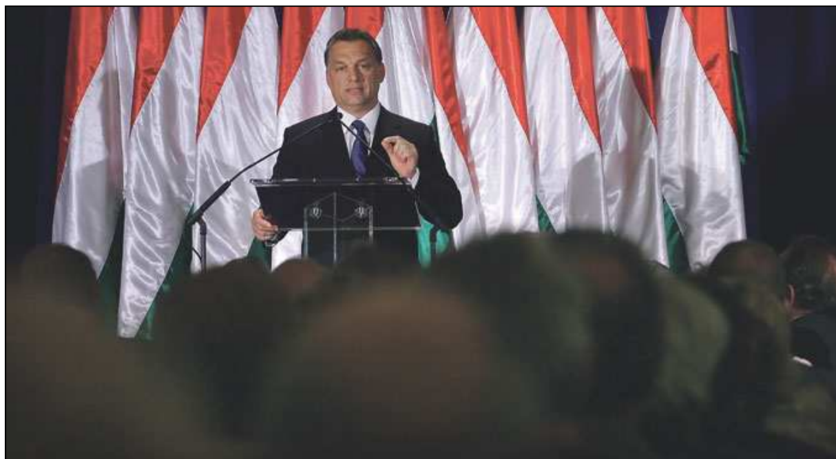
Orbán Viktor miniszterelnök: félrevezetik?

A túlfogyasztásról kigondolt elképzelés a Kádár-korszak végén – amikor a mű megjelent – sem volt igaz, semmilyen elemzés nem támasztotta ugyanis alá a feltételezést. A fogyasztás éppen hogy alacsony volt : más országokhoz képest is és saját adottságainkhoz képest is. A gondok forrása a termelésben keresendő és nem utolsósorban a termelési beruházások rossz szerkezetében és alacsony hatékonyságában. Végző soron tehát a gazdaságirányítás zavaraiiban : a rossz diagnózis – alkalmatlan terápia – gyenge színvonalú megvalósítás láncolatában. Leegyszerűsítve: nem tudnak kormányozni.